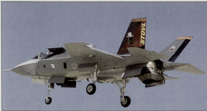
Kampfflugzeuge F-35B JSF sind für die neuen britischen Flugzeugträger vorgesehen.

Senkrechtstart-Version (STOVL-Version = Short Take Off and Vertical Landing) vorgesehen. Als weitere europäische Partnerstaaten haben bisher nebst Grossbritannien auch Norwegen, die Nieder-