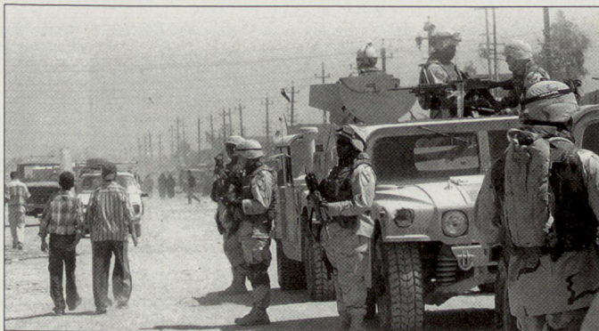
«Humvees» auf Patrouille in einem Vorort von Bagdad.

Eine der Hauptbedrohungen für die multinationalen Truppen im Irak bilden die improvisierten Sprengladungen, so genannte