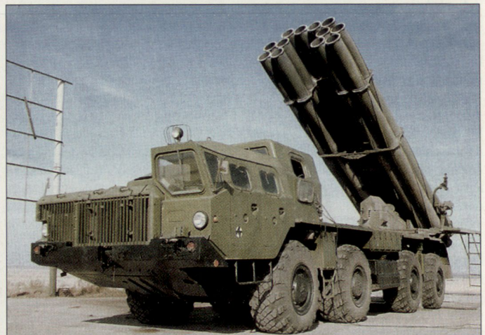
Mit den neuen verbesserten Raketen verfügt der schwere Mehrfachraketenwerfer vom Kaliber 300 mm «Smerch» über eine Reichweite von 90 km.

war einmal mehr wichtigster ausländischer Aussteller an der alle zwei Jahre stattfindenden Wehrmaterialausstellung «Defexpo». Diese grösste indische Rüstungsausstellung fand Ende Januar 2006