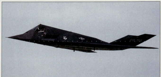
Die Stealth-Jagdbomber F-117 sollen aus Spargründen früher ausser Dienst gestellt werden.

vorzeitig ausser Dienst stellen bzw. deren Bestand massiv reduzieren. So soll die gesamte, heute noch 52 Maschinen umfassende F-117 Stealth-Jagdbomberflotte bereits bis 2008 ausgemustert werden.