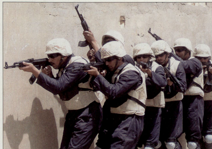
Irakische Polizisten, ausgerüstet mit Sturmgewehren AK-47.

ferter Waffen und Ausrüstung wurde in der NTM-I eine spezielle Training, Equipment and Synchronization Cell (TESC) gebildet. Diese koordiniert mit dem neuen irakischen Verteidigungsministerium (für die Streitkräfte) und mit dem Innenministerium (für die Polizeikräfte) die konkreten Bedürfnisse resp. die Eingliederung der von Partnerstaaten gelieferten Waffen und Ausrüstung. Die NATO hat im Jahre 2005 kostenlos Ausrüstung im Wert von über 100 Mio. an den Irak geliefert. Lieferungen erfolgten dabei von den NATO-Mitgliedern Rumänien, Slowenien, Dänemark, Griechenland, Estland, Litauen und Ungarn. Aus den ost- und mitteleuropäischen NATO-Staaten wurden vor allem Sturmgewehre AK-47, Helme und persönliche Ausrüstung gespendet. Diese Mittel sind für die irakischen Sicherheitskräfte willkommen, da die Iraker bisher primär mit östlichem Wehrmaterial ausgerüstet