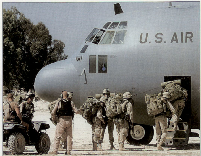
In der QDR 2006 wird u. a. eine weltweite flexible Einsatzfähigkeit aller Teilstreitkräfte gefordert.

■ Die Modernisierung der US Air Force, insbesondere die Beschaffung von UAVs, soll durch eigene luftwaffeninterne Einsparungen beschleunigt werden (siehe