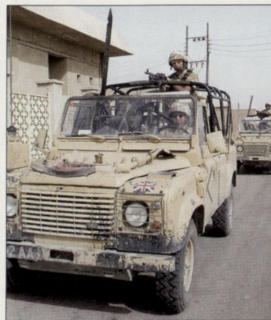
Britische Soldaten auf Patrouille in Basra, Irak.

Tatsache ist, dass sich heute bei den Streitkräften Grossbritanniens nebst dem Irakengagement insbesondere auch der starke Konkurrenzkampf der Privatwirtschaft