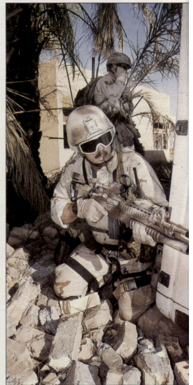
Bei den laufenden US-Operationen im Irak und in Afghanistan hat sich ein zunehmender Bedarf an Spezialkräften ergeben.

Viele der im Irak eingesetzten US-Einheiten müssen sich bis heute selber mit improvisierten Mitteln behelfen und patrouillieren auf den irakischen Strassen mit behelfsmässig aufgebauten Panzerplatten. Die bisher getroffenen Massnahmen sind jedoch nur von begrenztem Erfolg. Wie die aktuellen Beispiele zeigen, haben sich die Aufständischen und Terrorgruppen angepasst und reagieren auf diese Zusatzpanzerungen mit noch grösseren, wirkungsvolleren Sprengladungen. Die Sprengsätze sind zudem zunehmend so konzipiert, dass der Explosionsdruck gezielt auf die anfällige Unterseite der Fahrzeuge gerichtet wird und dadurch die «Humvees» förmlich zerrissen werden. hg