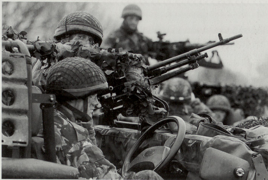
Paratroopers auf Land Rover WMIK ( weapons mounted installation kit ). Das WMIK, bestehend aus dem schweren MG Browning (12,7 mm) sowie einem 7,62-mm-MG. Das Fahrzeug als solches ist luftverlastbar, hoch mobil und damit ideal für Luftlandetruppen.

Photograph by: Chris Fletcher; © British Crown Copyright/MOD, image from www.photos.mod.uk . Reproduced with the permission of the Controller of Her Majesty's Stationery Office.