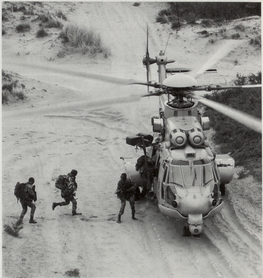
Der EC 725 Cougar wurde speziell für CSAR ( Combat Search and Rescue ) und Sonderoperationen entwickelt.

Ein weiterer Ansatz, um die Fähigkeitslücken im Bereich des strategischen Lufttransports zu überbrücken, ist das zeitliche Staffeln des Verlegens einer Kampfgruppe unter Einbezug von Seetransport. Das EU-Battle-Group -Konzept verlangt zwar, dass eine Kampfgruppe zehn Tage nach Entscheidung der EU in der Lage ist, eine Mission durchzuführen. Dies muss aber nicht unbedingt bedeuten, dass bereits der gesamte Verband vor Ort eingetroffen ist. Operation Palliser ist diesbezüglich geradezu beispielhaft.