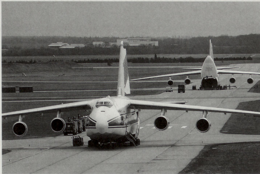
Die Antonov An-124 hat eine maximale Nutzlast von bis zu 150 t und verfügt über eine Reichweite von 4500 km. Am 23. März 2006 trat das multilaterale Vertragswerk SALIS in Kraft. Es sieht u.a. vor, dass zwei Transportflugzeuge des Typs Antonov An-124 der Firma Ruslan SALIS GmbH ständig auf dem Flughafen Leipzig-Halle stationiert sind.