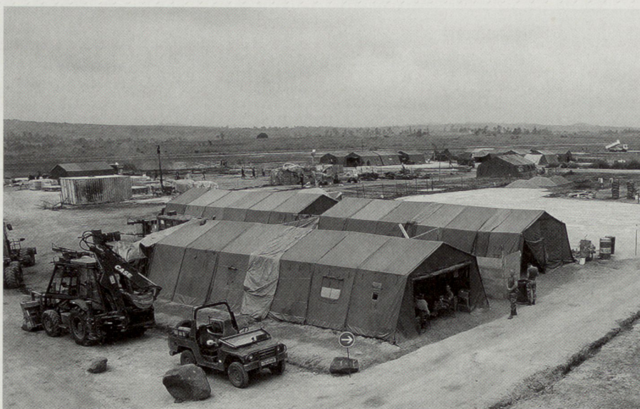
Camp der französischen Streitkräfte in Bunia während der Operation Artémis in der Demokratischen Republik Kongo. Die Operation Artémis , welche 2003 ohne Rückgriff auf NATO-Einrichtungen durchgeführt wurde und die erste autonome Militär-operation der EU darstellt, gilt offiziell als Vorläuferin des EU-Kampfgruppen-Konzepts.

Das folgende Jahr sah eine rasche Europäisierung der St.-Malo-Erklärung. Am Europäischen Rat in Köln (1999) wurde beschlossen, dass die EU mit militärischen Fähigkeiten zur Wahrnehmung der Petersberg-Aufgaben ausgestattet werden müsse. In der Folge wurden auf dem Gipfel in