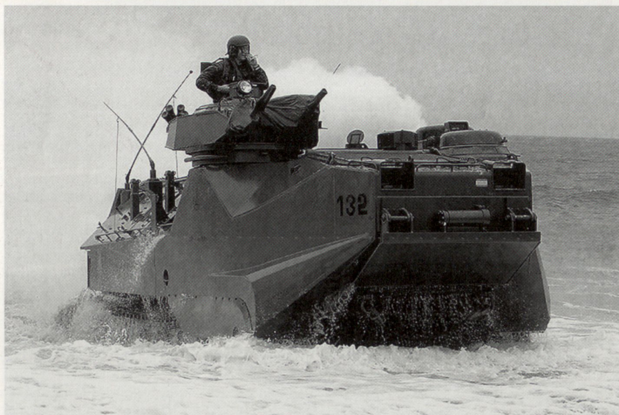
Amphibisches Fahrzeug der spanischen Marineinfanterie. Im ersten Halbjahr 2006 wurden Teile der Spanish Italian Amphibious Forces (SIAF) mit portugiesischer und griechischer Unterstützung im Rahmen des EU-Kampfgruppen-Konzepts in erhöhte Bereitschaft versetzt.

Dieses Engagement verlangt nach einer Modifizierung des Rekrutierungssystems in Schweden. Nach der regulären Dienstzeit können die Wehrmänner für weitere Jahre von den Streitkräften angestellt werden. Dies erlaubt es, sie für die internationalen Reaktionskräfte auszubilden und für den Ernstfall bereitzuhalten. Zudem soll die Zahl der neu zu rekrutierenden Soldaten auf möglichst tiefem Niveau gehalten werden. Gemäss dem Oberbefehlshaber der schwedischen Streitkräfte, General Ha-