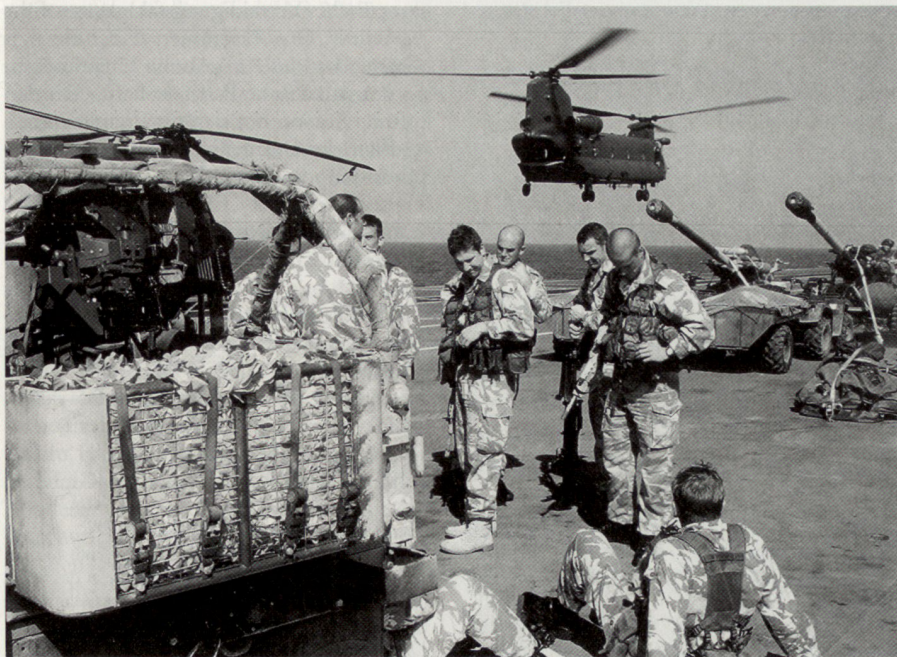
Royal Marines auf dem Hubschrauberträger HMS Ocean, im Hintergrund sind CH-47 Chinooks der RAF zu sehen. Während Luftlandetruppen die operative und taktische Initiative im Operationsgebiet durch Schockwirkung rasch an sich reissen, sichert der besser ausgerüstete amphibische Verband das Momentum.

2003 bekam die französische Interventionspolitik in Afrika eine neue Dimension, da sie nicht nur national, sondern multilateral abgestützt wurde. Auf Ersuchen der Vereinten Nationen lancierte die Europäische Union unter französischer Führung ihre erste unabhängige militärische Operation ausserhalb Europas. Hintergrund dieser Operation war der Konflikt in der Demokratischen Republik Kongo. Im Frühling 2003 wurde die Provinz Ituri in der Demokratischen Republik Kongo von Gewalt heimgesucht, als Milizen respektive reguläre militärische Kräfte aus Ruanda, Uganda und der Demokratischen Republik Kongo um die Kontrolle der ressourcenreichen Provinz zu kämpfen begannen. Innerhalb von zwei