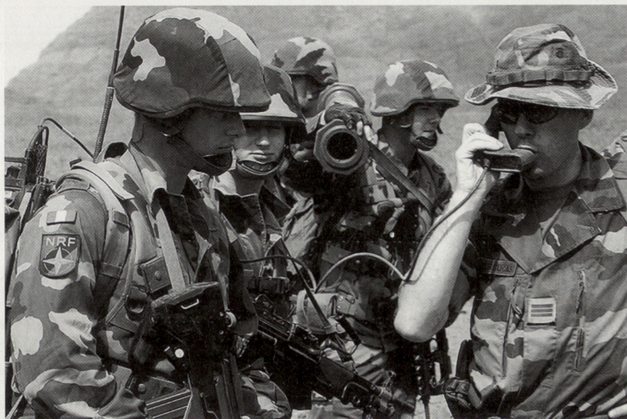
Französische Soldaten während der NATO-Übung Steadfast Jaguar 2006 in Kap Verde. Die Deutsch-Französische Brigade wird alternierend sowohl für die NATO Response Force als auch für die EU-Kampfgruppen in erhöhte Bereitschaft versetzt.

Nach dem politischen Entscheid, eine militärische Operation zu lancieren, soll eine EU BG innerhalb von zehn Tagen in eine Krisenregion verlegt werden und vorrangig, aber nicht exklusive, im Rahmen des Kapitels VII der UN-Charta eingesetzt