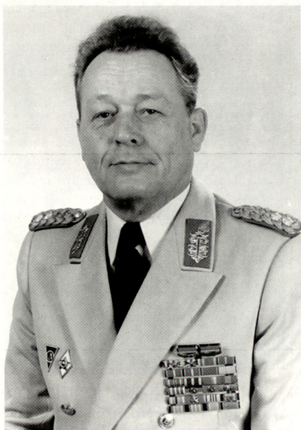
Generalleutnant Alfred Krause, letzter Chef der Aufklärung der Nationalen Volksarmee der DDR 1982–1990.

Die – nur noch sehr spärlich vorhandenen – Akten der HVA liegen darum mit den übrigen Stasi-Akten im Archiv der BStU-Behörde in Berlin. Der Zugang dazu, auch zu wissenschaftlichen Forschungszwecken, unterliegt zahlreichen Beschränkungen des «Stasi-Unterlagen-Gesetzes» (StGU) vom 20. Dezember 1991. Vor allem aber lassen sich die operativen Vorgänge der HVA aktenmässig deshalb kaum mehr erfassen, weil die HVA auf Grund eines Beschlusses des damaligen «Runden Tisches» (in der damaligen verworrenen Situation in der DDR gebildet aus Vertretern der Regierung, der Bürgerbewegungen und der Kirchen) ihre operativen Akten überwacht vernichten und sich selbst auflösen konnte. Der Vernichtung entgangen sind gewisse Aktenkopien, welche an den Minister gegangen waren und dort archiviert wurden, an Dritte geschmuggelte Akten oder Speicher (so z. B. die «Rosenholz-Papiere» des amerikanischen Nachrichtendienstes CIA) und eine kleine Zahl zum Teil umfangreicher Berichte, welche von der HVA aus diversen Motiven absichtlich liegen gelassen wurden.