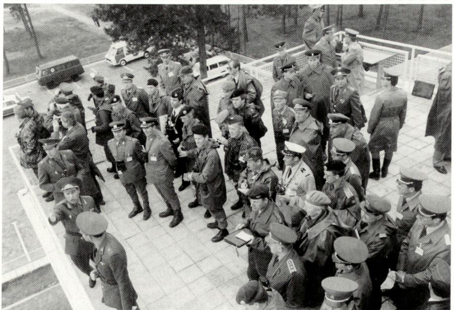
Anlässlich einer grossen Übung der Gruppe Sowjetischer Truppen in der DDR (GSTD) und der Nationalen Volksarmee (NVA) im Juli 1987 werden internationale Beobachter vom sowjetischen Kommandeur auf dem Truppenübungsplatz von Wittstock, nordwestlich von Berlin, in die Übung eingewiesen. Die westlichen Beobachter wurden damals immer von einer grösseren Schar ostdeutscher und sowjetischer Offiziere begleitet.

Zeitzeugen östlich des aufgehobenen «Eisernen Vorhanges» persönliche Gespräche zu führen, deren Standpunkte und Überlegungen kennenzulernen und deren Aussagen mit zeitgemässen Akten zu vergleichen. Durch die politischen Ereignisse in Europa (insbesondere der deutschen Wiedervereinigung) waren für eine zeitgeschichtliche Forschungstätigkeit nach den wissenschaftlichen Kriterien Unvoreingenommenheit, Seriosität und Suche nach der bestmöglichen objektiven Wahrheit Möglichkeiten eröffnet worden, wie sie sich Historikern wohl nur sehr selten anbieten. Es konnte daran gegangen werden, auch die oben erwähnten Befürchtungen anhand von grossen Aktenbeständen zu überprüfen und darüber mit vielen noch lebenden Zeitzeugen zu reden, die zufolge ihrer früheren Positionen kompetente Aussagen machen konnten.