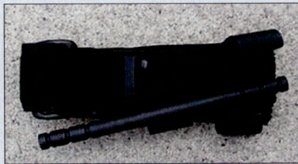
Tourniquet, Abbindmanschette für jeden Soldaten, die eine rasche Blutstillung an den Extremitäten ermöglichen soll.

Dies hat zu einer Neuorientierung des Sanitätsdienstes geführt, welche auch Ein-