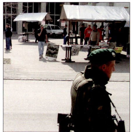
Der einsame Soldat auf Patrouille.

Damit ist auch die Bedeutung des einzelnen Soldaten im Einsatz massiv gestiegen. Er ist nicht mehr nur ausführendes Organ, das auf Befehl schießt und auf Befehl das Feuer wieder einstellt. Diese Serie beschäftigt sich mit den aktuellen Aspekten rund um die «Ressource Mensch».