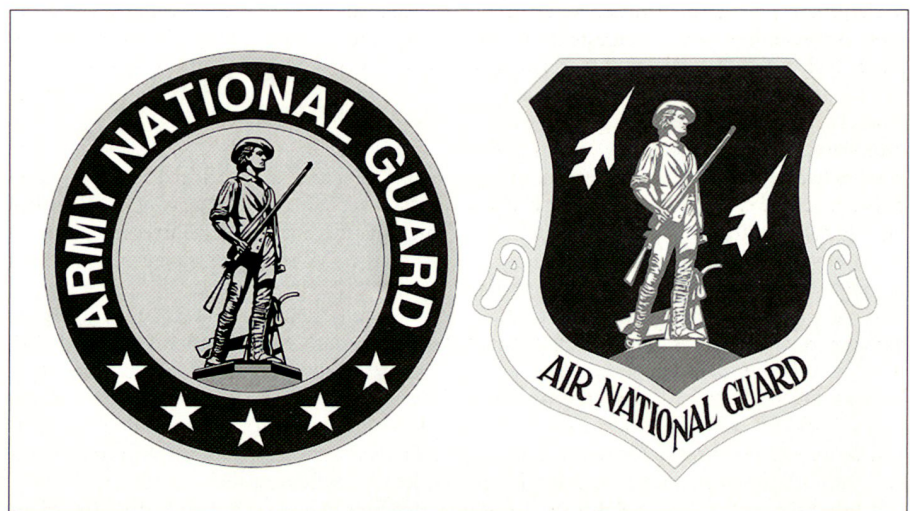
Nationalgarden des Heeres und der Luftwaffe.

Nach den Terrorangriffen des 11. September 2001 wirkten über 50 000 Guardsmen auf den Schadenplätzen und bei den Schutzmassnahmen mit, im Auftrag teils der Bundesregierung, teils des zuständigen Gliedstaates.