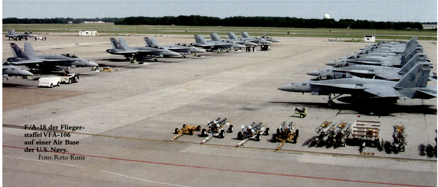
F/A-18 der Fliegerstaffel VFA-106 auf einer Air Base der U.S. Navy.

Die Begründung dafür wurde von der ersten Minute der Ausbildung klar: Das ganze System ist auf Operationen ab Flugzeugträger im nicht immer friedlichen