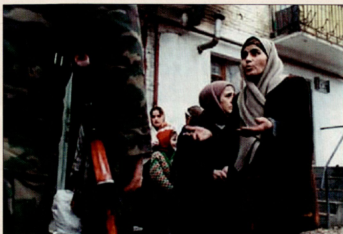
Der Kampf gegen Menschenhandel liegt auch im Aufgabenbereich eines Soldaten.

Jedes Jahr erzielt die kriminelle Tätigkeit des Menschenhandels weltweit einen Profit von schätzungsweise zwölf Milliarden Dollar.