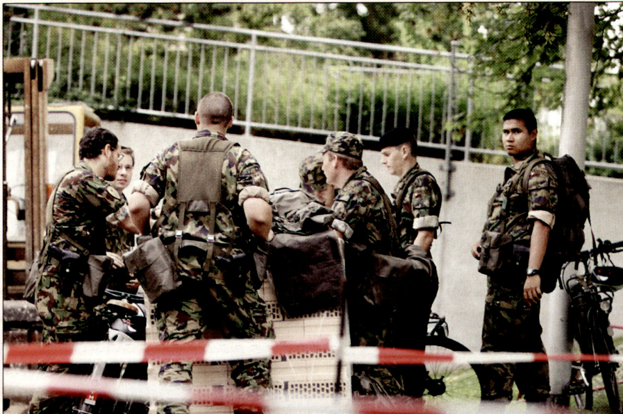
Am Schluss einer 24-stündigen Übung ohne Schlaf muss ein Verschiebungsbefehl gegeben werden. Dabei ist Führungspsychologie nicht mehr Theorie, sondern Anwendung.

entstand ein Methodenmanual, welches konkrete Vorschläge zur Umsetzung im Unterricht beinhaltet. Das Produkt wurde Mitte 2005 mit den Ausbildnern des Offizierslehrgangs erörtert und anschliessend leicht angepasst, sodass die Fallsammlung bereits im Herbst 2005 ins Ausbildungsprogramm eingebaut werden konnte.