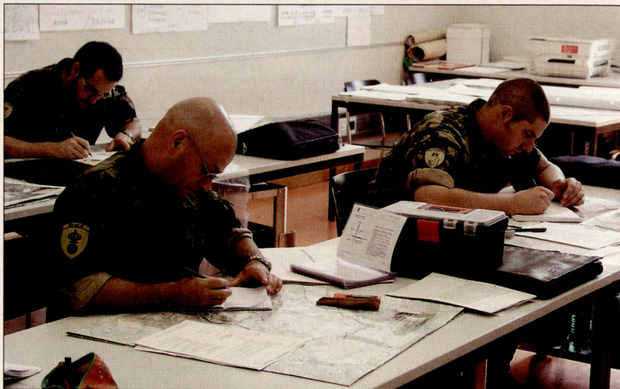
Teilnehmer des Führungslehrganges I (FLG I) führen ihre Problemerkennung/Auftragsanalyse durch und halten sich bereit, diese zu präsentieren. Zu den Lehrinhalten gehört auch im FLG I die Militär-ethik.

Auf dieser Grundlage wurden die vorhandenen Fälle zu acht «Modellfällen» verdichtet und didaktisch aufbereitet, d.h., man verlieh ihnen eine einheitliche Struktur und fügte Verweise zu relevanten Grundlagen (Dienstreglement, Führungsrichtlinien, Militärstrafrecht) hinzu. Zudem