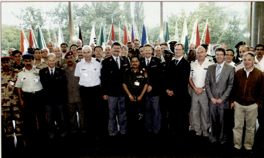
55 Teilnehmer aus 57 Staaten des Kurses SWIRMO besuchen das Kommando HKA und werden über die Kaderausbildung der Schweizer Armee und die Ausbildung im KVR informiert.

tional einen unschlagbaren Standortvorteil.