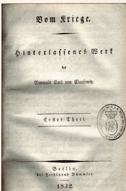
Titelseite des Hauptwerkes von Clausewitz in der Ausgabe Berlin 1832.

Weiterhin ordnet Clausewitz der Strategie fünf Einheiten zu, welche für diese von grundlegendem Einfluss sind. «Man kann die in der Strategie den Gebrauch des Gefechts bedingenden Ursachen füglich in Elemente verschiedener Art abteilen, nämlich in die moralischen, die physischen, die mathematischen, die geographischen und die statistischen Elemente.» 9