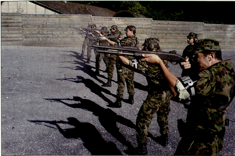
MP-Grenadiere bei der Ausbildung am Polizei-Mehrzweckgewehr.

den in Seiltechniken und im Einsatz mit dem Helikopter geschult.