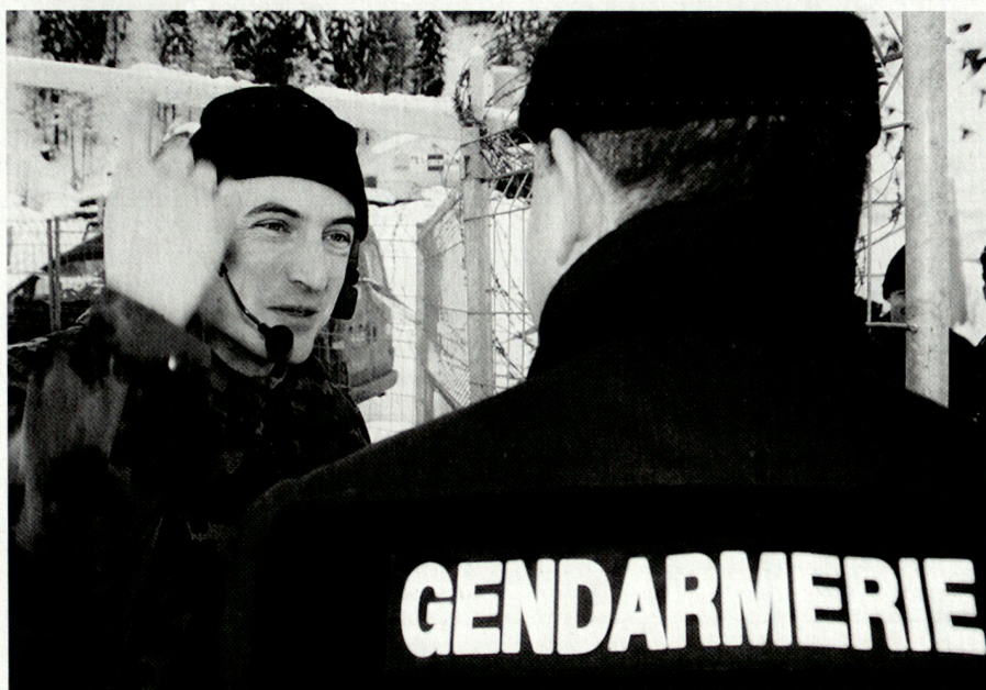
Collaboration entre l'armée et la police en matière de sécurité intérieure: World Economic Forum (2006).

(art. 92 Cst.) ou de l'énergie nucléaire (art. 90 Cst.). La Confédération protège également l'ordre constitutionnel des cantons lorsque ces derniers ne sont pas en mesure de garantir le fonctionnement des institutions (art. 52, al. 2, Cst.).