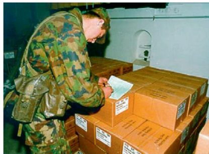
Abbildung oben: Munitionsverlad für den Bahntransport.