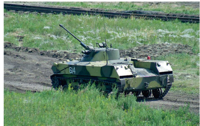
Luftlandepanzer BMD-3 in Georgien.

Die vor allem zu Beginn der Kampfhandlungen eingesetzten Luftlandetruppen stammten vermutlich aus der ehemaligen 7. Garde Luftlandedivision (HQ in Novorossiysk). Dieser Verband wird gegenwärtig umstrukturiert und soll künftig als Interventionsverband im Nordkaukasus vorgesehen sein. Diese Truppen der ersten Stunde dürfte sich unterdessen mehrheitlich aus Berufs- resp. Zeitsoldaten zusammensetzen. Erkennbar ist, dass den Luftlandeeinheiten in letzter Zeit wieder vermehrt neue