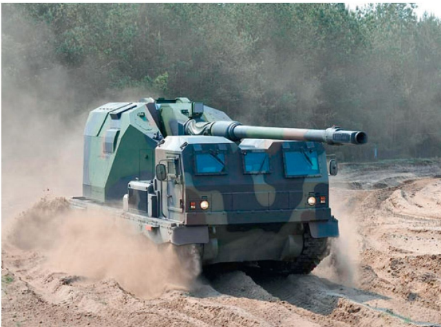
Mobiles Artilleriesystem 155 mm «Donar».

ser indirekter Feuerunterstützung. Vor allem in den Krisenregionen wie Afghanistan und Irak sind diese Geschütze eine notwendige Ergänzung zu den sogenannten luftnahen Unterstützungseinsätzen durch Kampfflugzeuge und Helikopter.