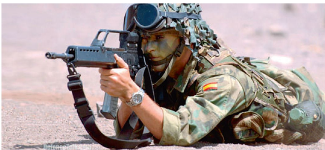
COMFUT für spanische Soldaten.

FUT» stattgefunden. Unterdessen finden die entsprechenden Auswertungen statt und mit Beginn 2009 sollen 24 modifizierte resp. weiter verbesserte Systeme der Truppe für Versuche zur Verfügung gestellt werden. Die Einführung des «COMFUT» soll in drei Phasen, vermutlich ab 2009 stattfinden. Die Zusammensetzung der neuen Ausrüstung variiert je nach Truppengattung, Funktion, Einsatz und Einsatzdauer. Der genaue Umfang der Beschaffungen soll erst nach Abschluss der Truppenversuche definiert werden. Gegenwärtig geht man von ungefähr 19 000 Systemen aus, wobei mit einem Stückpreis von 20 000 Euro gerechnet wird.