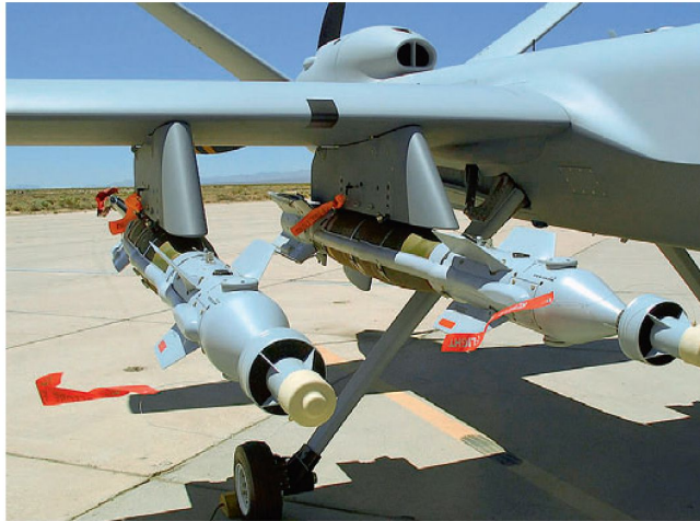
MQ-9 «Reaper» mit lasergelenkten Präzisionsbomben.

Gemäss Informationen aus den USA will die deutsche Bundeswehr amerikanische Kampfdrohnen des Typs MQ-9 «Reaper» beschaffen. Die für Rüstungsverkäufe zuständige US-Behörde DSCA (Defense Security Cooperation Agency) hat im August 2008 den amerikanischen Kongress diesbezüglich informiert. Die deutsche Bestellung umfasst angeblich vier Gesamtsysteme «Reaper» inkl. fünf Flugkörper sowie die notwendigen Zubehör- und Ausbildungskomponenten. Dabei geht es um ein Gesamtvolumen von rund 205 Mio. US Dollar. Deutschland will angeblich diese unbemannten Einsatzmittel für die Verteidigung seiner Truppen im Ausland (primär in Afghanistan) einsetzen. Dabei soll vor allem auch eine