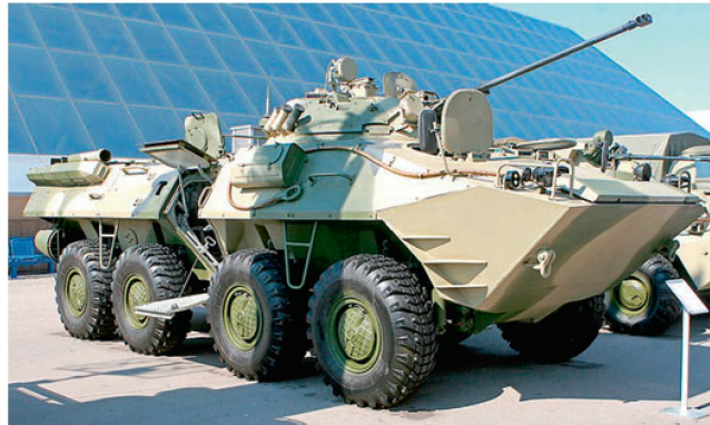
Grundversion des BTR-90