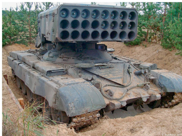
TOS-1 «Buratino» in Feuerstellung.

Die Entwicklung des seinerzeit als Flammenwerferpanzer vorgesehenen TOS-1 geht auf die späten 70er Jahre zurück. Der auf einem Chassis des Kampfpanzers T-72 montierte Werferteil verfügt über 30 Abschussrohre, die ursprünglich primär für das Verschiessen von Brandgranaten vorgesehen waren. Geplant war der Einsatz solcher Waffensysteme gegen Befestigungsanlagen und Gebäudekomplexe sowie im Rahmen damaliger Angriffsplänen auch zur Bekämpfung gegnerischer Stützpunkte. Flammenwerferpanzer vom Typ TOS-1 waren bei den früheren WAPA-Streitkräften auf Stufe Armee eingeteilt und wurden je nach Bedarf an die Kampfdivisionen abgegeben.