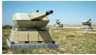
Waffensystem NBS C-RAM.

Die vorgesehene Truppenverstärkung bei der ISAF in Afghanistan wird in Deutschland zunehmend kritisiert. Dabei wird von militärischer Seite vor allem auf die bestehenden Schwachstellen und Fähigkeitslücken bei der Bundeswehr hingewiesen. Denn in den aktuellen Einsatzgebieten der deutschen Truppen ist künftig nicht nur mit einer Bedrohung durch IED's (Improved Explosive Devices), sondern auch mit einem vermehrten Waffenbeschuss zu rechnen. Die Verschlechterung der Sicherheits-