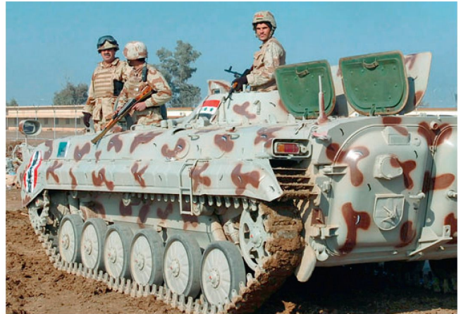
Schützenpanzer BMP-1 des irakischen Heeres.

Die USA haben gemäss eigenen Angaben bisher weit mehr als 20 Mrd. US Dollar in Aufbau, Ausrüstung und Aus-