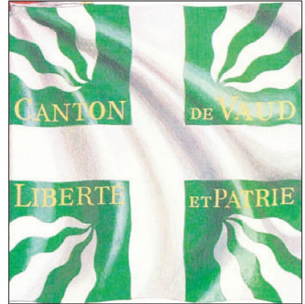
Bild 3: Militärfahne nach dem Allgemeinen Militär-Reglement von 1817: Waadtländer Bataillonsfahne von 1819 mit durchgehendem Kreuz und rot/weisser Schleife.

Das Reglement von 1852 über die «Bekleidung, Bewaffung und Ausrüstung des Bundesheeres» bestimmte: «Alle Truppenabteilungen im eidgenössischen Dienst führen ausschliesslich die eidgenössische Fahne.» 12 (Bild 4). Nach diesem Reglement wurde neu auch jeder Schwadron eine Kavallerie Standarte zugeteilt. 13