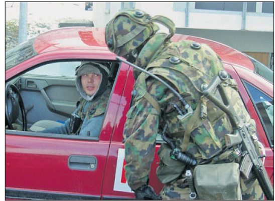
Das Reizstoffsprüngerät (Gürtel links) stellt einen relativ wirksamen und kostengünstigen Mittelweg zwischen «Schiessen» und «Rufen» dar. Die schnittfesten Handschuhe behindern den Soldaten bei dieser Verkehrskontrolle nicht.

ten oder einen Handwerker mit einem technischen Gerät handelt. Die Auftrags-erfüllung hängt auch hier unmittelbar mit einem technischen Kleingegenstand zusammen.