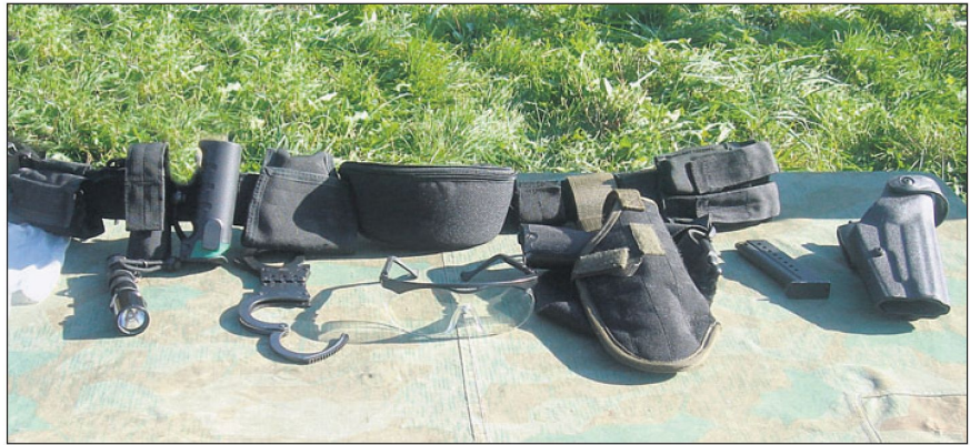
Möglicherweise entscheidende Details (v.l.n.r.): wirksame Taschenlampe, Reizstoff-spray als Zwischenwaffe, Handschellen, Schutzbrille, Zweitwaffe, griffbereite Reservemagazine, Holsteralternative mit Entreisssicherung.

Demzufolge muss die Auswahl auch des Kleinmaterials sich nach den aktuellen Bedürfnissen der Truppe richten und die Einsatztauglichkeit ständig überprüft werden. Die Beschaffungszeit muss drastisch verkürzt werden und im Rahmen eines rüstungstechnischen Small-Governments muss die Verantwortung auf die Stufe delegiert werden, die es letztlich betrifft. Das bedeutet nicht, dass jeder Schulkommandant einen eigenen Beschaffungskredit bekommen sollte, wohl