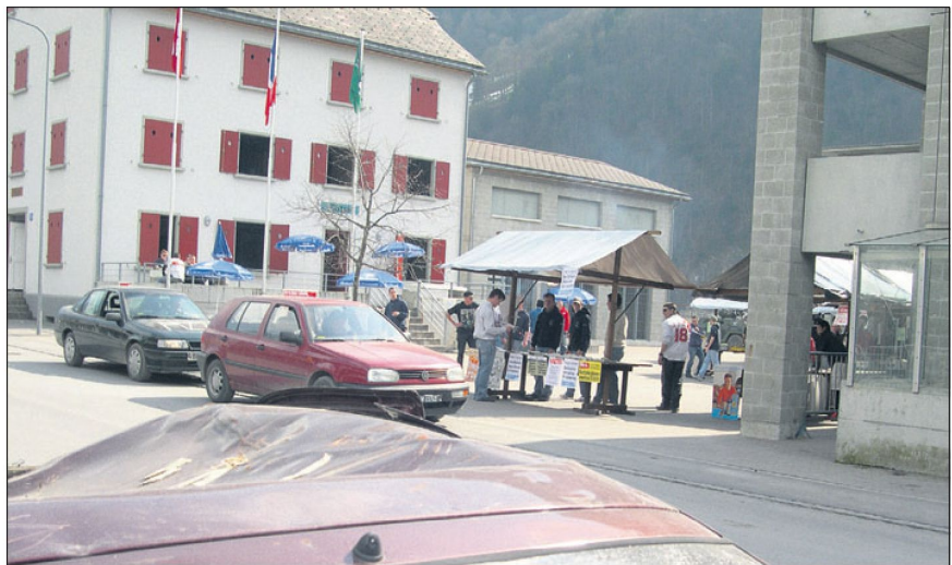
Mögliches modernes Einsatzumfeld.

aber, dass beispielsweise der Lehrverband Infanterie kurzfristig darüber entscheiden kann, ein bestimmtes Produkt auf dem freien Markt zu erwerben. Die gebetsmühlenartig wiederholten Forderungen nach Einheitlichkeit in der Ausrüstung helfen auch hier nicht weiter.