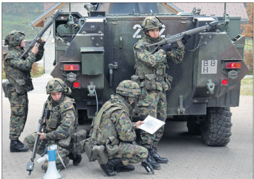
Ein wertvolles Instrument für die laterale und vertikale Kommunikation im urbanen Einsatz: ein simples Megaphon.

Verfügt Sorgenfrei über das Weisslicht-Set an seinem Gewehr, kann er das Ziel beleuchten, blenden und genau identifizieren. Dabei stellt er vielleicht fest, dass es sich um einen erschrockenen Polizis-