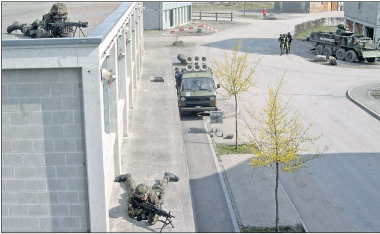
Vier bedeutende Komponenten: 1. Zielfernrohr: Präzision, 2. Leichtes Maschinengewehr: Feuerkraft, 3. Lautsprecherwagen: Kommunikation, 4. Räumschild am Radschützenpanzer: Mobilität.