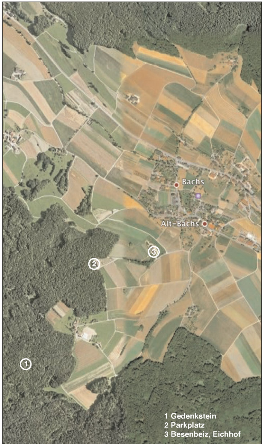
1 Gedenkstein 2 Parkplatz 3 Besenbeiz, Eichhof

nis zu unserer Geschichte, auch zu derjenigen des Zweiten Weltkriegs. Der letzte Satz der Inschrift lautet: «Der Vollzug der Urteile bezeugt die Entschlossenheit von Volk und Armee im Zweiten Weltkrieg, die Unabhängigkeit unseres Landes gegen jede Bedrohung zu bewahren.» Unseres Erachtens Grund genug und noble Pflicht der späteren Generationen, Anerkennung und Dankbarkeit in Bronze zu giessen.