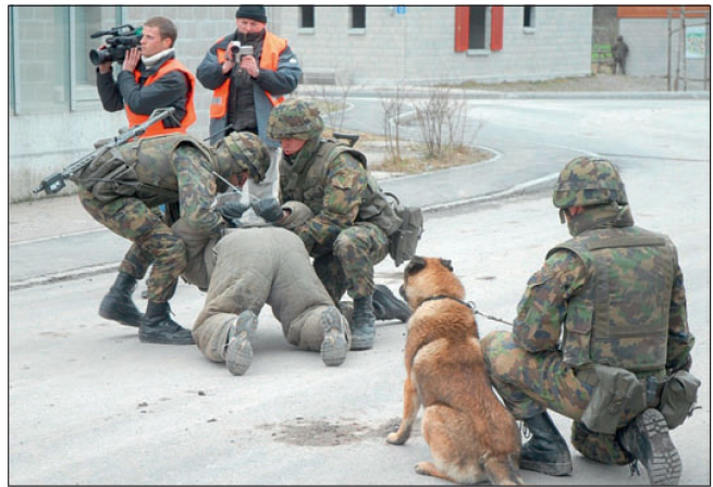
Abb 3: Mediales Umfeld.