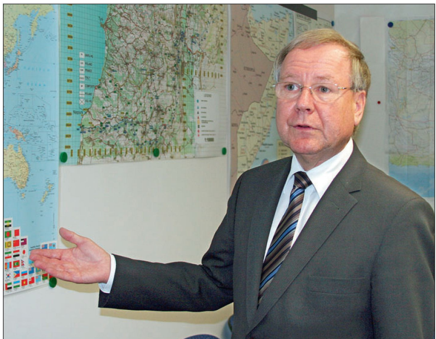
Der Nachrichtenchef beim Lagevortrag.

Die Behauptung, die Schweiz habe eine Vielzahl von Nachrichtendiensten