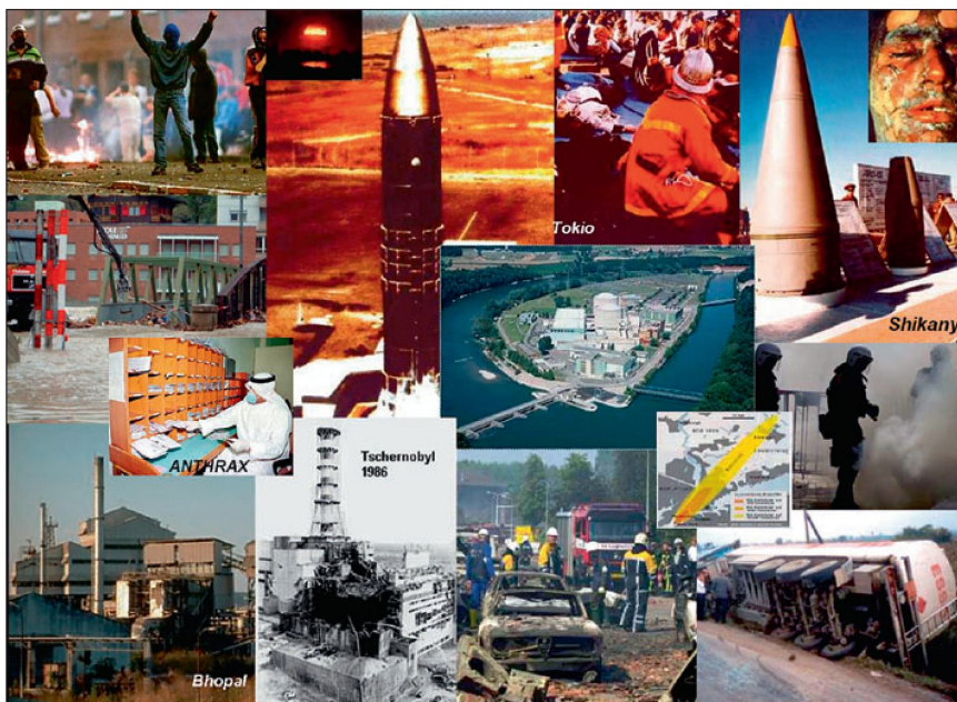
Abb. 1: Das Bild illustriert das vielfältige, radiologische, atomare (nukleare), biologische und chemische Bedrohungsspektrum. Viele Szenarien können ohne Vorwarnung und unterhalb der Kriegsschwelle eintreten und auch Armeeinsätze erschweren oder sogar in Frage stellen.

«Im Rahmen von ABC Abwehr- und Schutzmassnahmen geht es sowohl um präventive (Warnung, Vorbereitungen) als auch um reaktive Massnahmen (medizinische Hilfe, Dekontamination). Diese werden durch die Truppe im