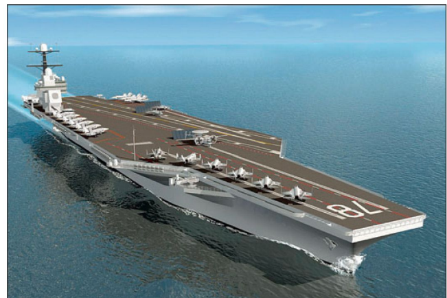
Skizze des neuen US Flugzeugträgers CVN-78.

Gerald R. Ford war bekanntlich der 38. Präsident der USA; er diente im Zweiten Weltkrieg als Kapitänleutnant auf dem Flugzeugträger «USS Monterey» (CVL-26).