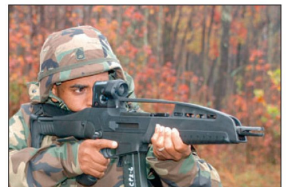
Versuche mit Sturmgewehr XM8 bei der US Army.

besten abgeschnitten haben. Diese Schiessversuche fanden in der von der US Army betriebenen Versuchseinrichtung Aberdeen Proving Ground in Maryland statt, wobei vor allem der Waffeneinsatz unter extremen Umweltbedingungen getestet wurde. Denn Erfahrungen sollen aufgezeigt haben, dass beim amerikani-