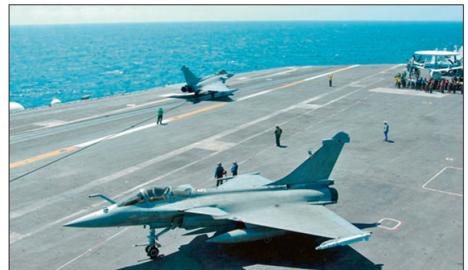
Kampfflugzeuge «Rafale» auf französischem Flugzeugträger.

Für die französischen Luftstreitkräfte (rund 50 000 Mann) sind im Weissbuch noch 300 Kampfflugzeuge («Rafale» und modernisierte «Mirage 2000») vorgesehen. Die Marine soll