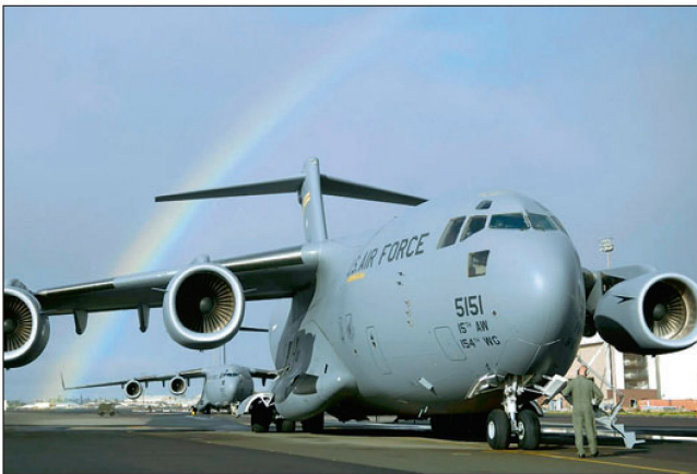
Transportflugzeug C-17 «Globemaster III».