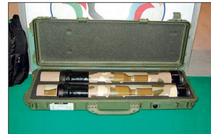
Transportbehälter mit Raketenrohr RPG-32.

Anlässlich der Ausstellung «Expo Arms 2008» wurde einmal mehr die Wirkung von Panzerfäusten sowohl mit Tandemhohlladung- als auch mit thermobarischen Gefechtsköpfen demonstriert. Nebst den bisher bekannten Typen RPG-7, RPG-26, RPG-28 und RPG-29 wurde an der Ausstellung erstmals die neue tragbare Waffe RPG-32 vorgestellt. Das neue Raketenrohr RPG-32 «Kashim» wurde in Zusammenarbeit zwischen Bazalt und der jordanischen Armee entwickelt. Die Waffe mit