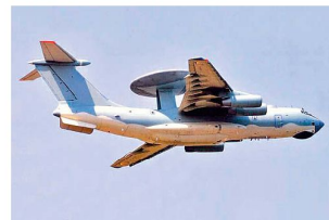
AWACS-Flugzeug KJ-2000 aus chinesischer Produktion.

Kampfflugzeugen, Bombern, Spezialflugzeugen und Heli-