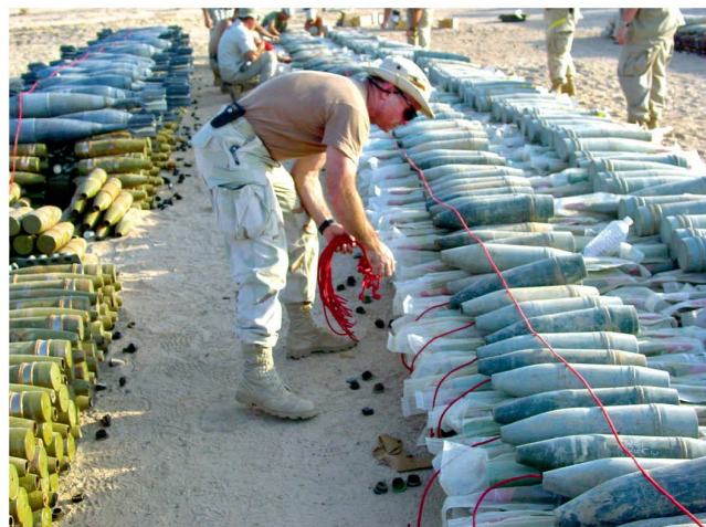
Munition wird zur Zerstörung vorbereitet.

Das Ottawa-Übereinkommen von 1997 über das Verbot eines Einsatzes sowie der Lagerung, Herstellung und Weitergabe von Personenminen ist das zentrale Vertragswerk zur weltweiten Ächtung dieser Waffenart. Seit seinem Inkrafttreten im Jahre 1999 gilt es als Meilenstein des humanitären Völkerrechts. Die Umsetzung des Ottawa-Übereinkommens ist bisher erfolgreich verlaufen, da insbesondere der Handel mit Personenminen praktisch zum Erliegen gekommen ist. Seit dem Inkrafttreten sind weltweit mehr als 40 Millionen Personenminen in Lagerbeständen vernichtet worden; zudem haben 140 Vertragsstaaten, darunter auch die Schweiz, ihre Einsatzbestände vollständig zerstört.