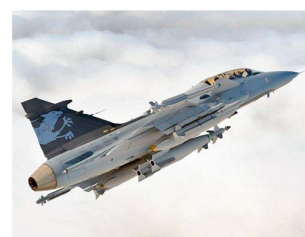
Kampfflugzeug «Gripen NG».

gen (siehe ASMZ Nr. 03/2009, Seite 38) Entscheidung-