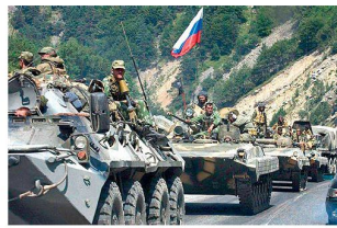
Russischer Mot Schützenverband in Georgien.

Seit Jahren versucht Russland, seine Streitkräfte zu reformieren und gleichzeitig auch zu modernisieren – bisher mit wenig Erfolg (siehe auch ASMZ Nr. 03/2009, Seite 40). Gemäss Informationen aus dem russischen Verteidigungsministerium soll der Krieg in Georgien im Sommer 2008 einmal mehr aufgezeigt haben, dass vor allem bei den Landstreitkräften umfassende Reformen dringend notwendig sind. Nebst den Bestandesreduktionen bei Personal und Waffensystemen