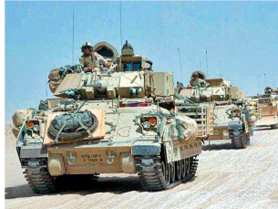
Kampfschützenpanzer M-2A2 «Bradley».

Afghanistan sind immer mehr Zweifel am taktischen Nutzen der FCS-Fahrzeuge aufgekommen. Denn das aufwändige und kostspielige FCS-Programm war im Wesentlichen noch auf die traditionelle