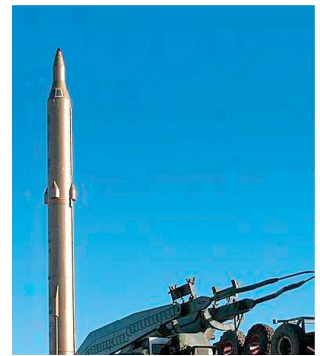
Iranisches Lenkwaffensystem «Sejil».

Im Zusammenhang mit dem laufenden ballistischen Raketenprogramm «Ashura» hat der Iran im Verlaufe der letzten Monate diverse Tests durchgeführt; dabei sollen auch erstmals Lenkwaffen des neuen Typs «Sejil-2» eingesetzt worden sein. Beim Boden-Boden Lenkwaffensystem «Sejil» handelt es sich um eine Mittelstreckenrakete mit Feststofftriebwerk und einer maximale Reichweite von ca. 2000 km. Bei der zweistufigen Rakete dürfte es sich um eine Weiterentwicklung der «Shahab-3» handeln, die in