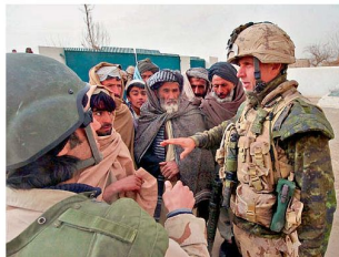
Information der Zivilbevölkerung in Afghanistan.

US-Streitkräften, Grossbritannien (rund 9000), Deutschland (4300) sowie Frankreich und Italien (je ca. 3000 Soldaten). Die von den europäischen Bündnispartnern zu-