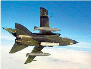
Verbesserte Aufklärungssysteme für «Tornado»-Aufklärer.

Seit Frühjahr 2007 werden sechs deutsche Aufklärungsflugzeuge «Tornado» zur taktischen Luftaufklärung in Afghanistan eingesetzt. Um die Fähigkeiten dieser «Recce-Tornados» an den aktuellen Auf-