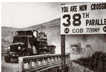
Solche Bilder sah man selten: US Fahrzeuge überqueren den 38. Breitengrad auf dem Rückzug, von Nord nach Süd.

Trotz der Unsicherheit erklärte Kim Il Sung um 13.35 am Radio Pyongyang, Südkorea habe angegriffen und sei in Haeju eingedrungen. – In Südkorea zeichneten