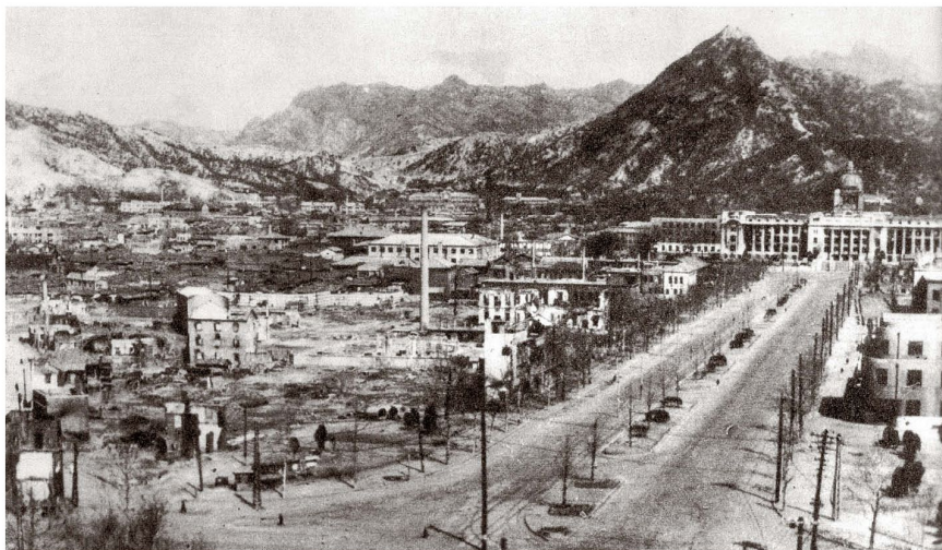
Zerstörtes Seoul 1951. Am Ende der Sejong-no Avenue das Capitol Building.

Was war jetzt los: Wieder Grenzverletzungen oder Krieg? Niemand wusste Bescheid: Es erklärten der US Botschafter Muccio um 09.30 Uhr und die südkoreanische Regierung um 11 Uhr, man wisse nicht, ob es sich um übliche Grenzverletzungen oder einen Krieg handle. Das US Fernostkommando in Tokio gab bekannt, Südkorea habe Nordkorea angegriffen (das wurde um 17 Uhr korrigiert). Die südko-