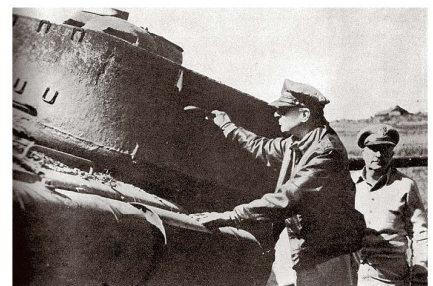
General MacArthur, Kommandant der UN Truppen, besichtigt einen zerstörten nordkoreanischen Panzer. Erst nach dem Eintreffen der amerikanischen Truppen hatten die Süd-Streitkräfte die Mittel, um feindliche T-34 abzuschiessen.

Die Staatschefs von Nord- und Südkorea, Kim Il Sung (35 Jahre alt, ehemaliger Partisanenführer und Bataillonskommandant in der 88. sowjetischen Brigade) und Syngman Rhee (73, hatte während 40 Jahren in den USA gelebt und eine christliche Schule geleitet) erklärten damals übereinstimmend, sie seien für eine friedliche