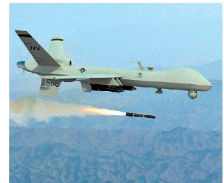
Zahl der bewaffneten UAV's wird weiter zunehmen.

2020 zurückgehen. Diese Bestandesreduktion soll durch die laufende Zuführung von Jagdflugzeugen der fünften Generation (u. a. F-35) aufgefangen werden. Bis 2020 sollen etwa 1000 Maschinen