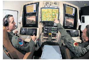
Führung und Einsatzplanung von UAV's benötigt viel Personal.

Tempo der Indienstellung neuer Drohnensysteme (UAV-Systeme) mithalten. Denn für die Führung und Einsatzplanung von ferngelenkten UAV's wird eine grosse Zahl von Piloten und Spezialisten benötigt. Die Air Force rief daher pensionierte Piloten auf, sich für die freiwillige Reaktivierung zu melden. In den letzten Monaten sollen sich gemäss Pentagon mehr als 1000 Offiziere a.D. gemeldet