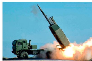
Mehrfachraketenwerfer «HIMARS» in Afghanistan.

auch GPS-gelenkte Minenwerfergranaten 120 mm zum Einsatz gelangen. Leichte Mehrfachraketenwerfer vom Typ «HIMARS» mit sechs Abschussrohren werden seit einiger Zeit in Afghanistan eingesetzt. Sie ermöglichen die frühzeitige Bekämpfung feindlicher Ziele bis maximal 70 km, wobei leistungsfähige Aufklärungs- und Feuerleitmittel notwendig sind. Bei Operationen im urbanen Umfeld werden die Systeme «HIMARS» gegen unterschiedliche Ziele eingesetzt, wobei damit auch vermehrt erkannte Sprengfallen über grössere Distanzen bekämpft werden sollen. Aber