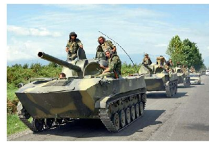
Geschütze 120 mm 2S9 auf der Verschiebung.

teten Waffen und Geräte, die bei den russischen Truppen im Kaukasus immer noch vorhanden sind. So kamen bei den eingesetzten Truppen der 58. Armee nur ungenügend gepanzerte Fahrzeuge (hauptsächlich BTR-70/BTR-80 und BMP-1/BMP-2) sowie veraltete Kampfpanzer (T-72M und teilweise noch T-55M) zum Einsatz. Zudem sollen die veralteten optronischen und übermittlungstechnischen Geräte die Einsatzfähigkeit nachteilig beeinflusst haben. Bei der Artillerie zeigten sich Mängel bei der Feuerführung und Feuerleitung, die beispielsweise ein rechtzeitiges Konterbatteriefeuer verunmöglicht hätten. Dazu kam das Fehlen moderner Munitionstypen, insbesondere von Präzisionsmunition für Geschütze 152 mm. Die