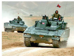
Schützenpanzer CV-9030 im Auslandeinsatz.

rund 3500 Wehrdienstpflichtige. Für die separate Heimatverteidigung stehen rund 47 000 Reservisten zur Verfügung.