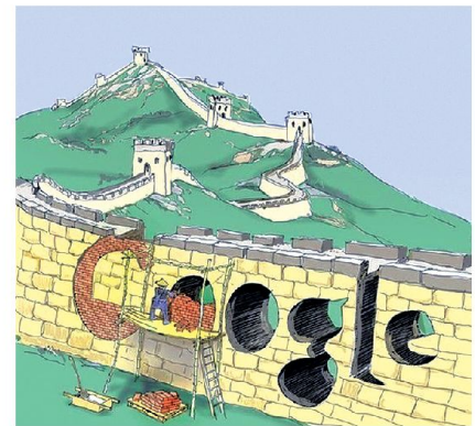
China baut seine Abwehr gegen den mächtigen amerikanischen Konzern Google aus.