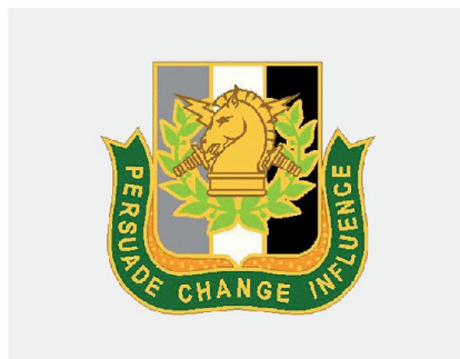
Emblem U.S. Army PSYOP.

Das Informationszeitalter zeichnet sich durch globale Vernetzung, den uneingeschränkten Zugang zu Informationen, sowie deren rasche Verarbeitung und Verbreitung in einem mobilen Umfeld aus. Die Verwundbarkeit des Staates bzw. seiner Gesellschaft gegenüber technischen Störfällen oder manipulierten Informationen nimmt dadurch drastisch zu. Störungen können das ordentliche Funktionieren von Staat und Gesellschaft empfindlich beeinträchtigen. Primäres Ziel eines Angreifers in der Informationssphäre ist, die Handlungsmöglichkeiten eines Akteurs einzuschränken sowie dessen Entscheidungsfindung zu beeinflussen. Klassische Mittel wie Propaganda oder Desinformation und Täu-