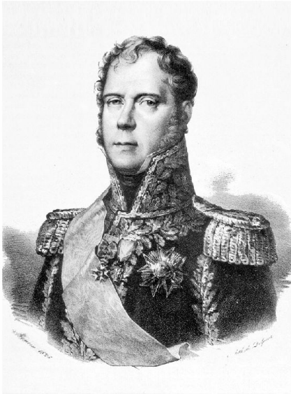
Marschall Michel Ney, Förderer von Jomini.

Lebensgefahr, indem er ihn unter Hausarrest stellte und gegen ihn die Todesstrafe beantragen will. Mehrfach gedemütigt und in auswegloser Lage entschliesst sich Jomini tatsächlich, die Dienste der Russen anzunehmen. Er handelt mit ihnen das Abkommen aus, dass er keine Geheimnisse Frankreichs mitzuteilen habe. Sodann ist er Schweizer, Ausländer für Frankreich wie für Russland, Spezialist in Militärfragen und als solcher wird er als Neutraler selbst von Napoleon – zumal in dessen Verbannungsort St. Helena – ausdrücklich von jeglicher Widerrechtlichkeit und Schuld freigesprochen.