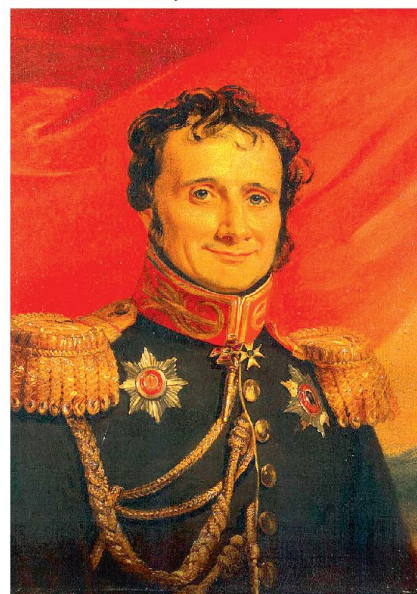
General Antoine-Henri Jomini (Atelier Geo Dawe 1823–1825, St.Petersburg, Winter Palace War Gallery).

Was die Beresina nicht geschafft hatte, Berthier gelingt es. Er bringt Jomini in