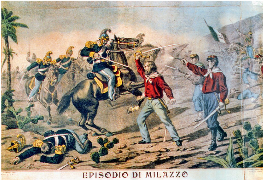
EPISODIO DI MILAZZO

Garibaldi im Kampf während des Zugs der Tausend.