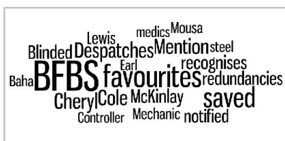
Tag-Cloud mit den 20 am häufigsten neu in der Website der British Army vorkommenden Begriffen.

Für die Erfassung der neu vorkommenden Begriffe wird eine Frequenzanalyse mit der Tiefe 2 benutzt. Dies meint die Startseite sowie Webseiten, die innerhalb der Domain liegen und mit einem oder maximal zwei Klicks erreichbar sind. Diese Tiefe ermöglicht eine Analyse von Inhalten, die zu unterschiedlichen Zeitpunkten online gestellt wurden. Genaue Angaben zum Zeitabschnitt können jedoch nicht gemacht werden, da sie stark von der Frequenz der neuveröffentlichten Artikel auf einer Webseite abhängen. Je mehr neue Artikel erscheinen, desto schneller rutschen alte in den Hintergrund. Bei Webseiten, die regelmässig Neuigkeiten veröffentlichen, gilt: Je älter ein Artikel ist, desto tiefer ist er in einer Webstruktur zu finden. 8