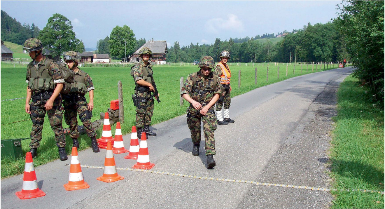
Nagelgurte am Check Point.

zen. Verlangsamten von Zielfahrzeugen beziehungsweise offensiven Fahrzeugen der Gegenseite, zum Beispiel Lastkraftwagen, auch Lastwagen oder Camions mit unkonventioneller Spreng- oder Brandvorrichtung (IED: improvised explosive devices). In temporären und oder kurzfristigen Objektschutzzeinsätzen besteht das Ziel, Fahrzeuge an der Weiterfahrt sofort zu hindern respektive die Weiterfahrtstrecke zu limitieren.