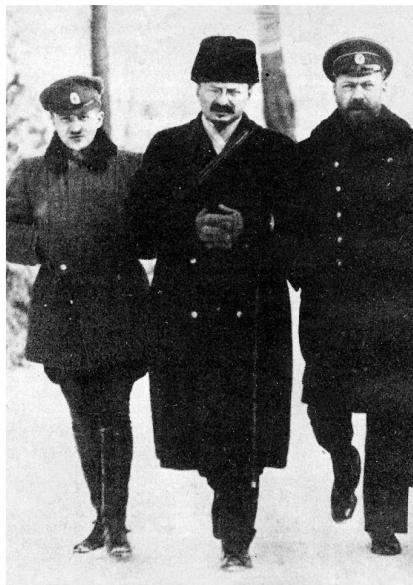
Als der oberste Diplomat Sowjetrusslands.

Als der berühmte Generalissimus in den vordersten Linien erschien, begann sich das Blatt zu wenden. Die zurückweichenden revolutionären Regimenter liessen sich von ihrem Meister derart hinreissen, dass sie zum Gegenangriff schritten.