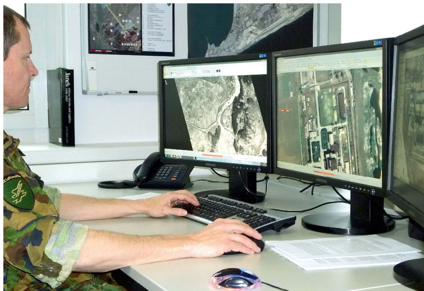
Auswerter bei der Bildanalyse.

Im Rahmen der IOC soll auch ein wirksamer Sensor to Effektor Loop, wie er heute schon bei Sicherungseinsätzen wie zum Beispiel beim WEF existiert, als Kernkompetenz in der Armee etabliert werden. Dabei werden Echtzeitdaten von Sensorplattformen wie FLIR SuperPuma (Forward Looking Infrared Sensor) oder ADS-95 direkt an die Einsatzkräfte am Boden (Effektor) übertragen. Zudem sollen die Voraussetzungen geschaffen werden, diese Bilddaten im Center für die weitere Analyse zu integrieren, zu speichern und auszuwerten. Hier steht denn auch noch einiges an Arbeit an, sind doch die Anforderungen, Verantwortlichkeiten, Prozesse und Schnittstellen genau zu definieren. Der Aufbau von Targeting Fähigkeiten (Zielzuweisung), wie sie heute bei ausländischen Streitkräften teilweise besteht, kann Gegenstand des Endausbaus zu einem späteren Zeitpunkt sein. Dies ist jedoch von den Resultaten der zur Zeit laufenden Diskussion um die Weiterentwicklung der Armee abhängig.