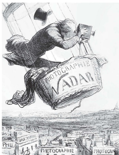
Der französische Luftbildpionier Nadar im Ballon, nach Honoré Daumier, 1896.

Heute – im digitalen Zeitalter von Internet, Smartphones, GPS und «Navis» – sind Dienste wie jene von Google Earth® aus unserem Alltag nicht mehr wegzudenken. Wir erkunden rasch die Umgebung der gebuchten Hotelanlage, visualisieren die Anfahrt zu Freunden oder wollen uns Venedig mal von «oben» ansehen. Die Vorteile dieser leicht zugänglichen, einfach zu bedienenden, vielfältig einsetzbaren und raschen Informa-