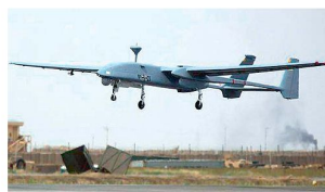
Start einer Aufklärungsdrohne «Heron 1» im Einsatzgebiet.

Gemäss Aussagen von Vertretern des deutschen Fahrzeugherstellers Krauss-Maffei Wegmann (KMW) wird heute bereits jedes zweite Einsatzfahrzeug der Bundeswehr in Afghanistan durch Spezialisten dieser Firma gewartet und unterhalten. Am Abend werden die im Einsatz gestandenen Fahrzeuge im Feldlager Masar-e-Sharif bereitgestellt, damit die Techniker und Servicefachleute von KMW über Nacht sowohl Reparaturen als auch die Wartung der Motoren durchführen können. Im Zuge der bei der Bundeswehr