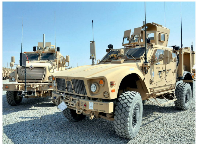
MRAP-Fahrzeuge der US Army.

Wirtschaftlichkeit untersucht. Dies soll bereits beim gegenwärtig wichtigsten Army-Projekt, beim Entwicklungsprogramm «Ground Combat Vehicle» (GCV) umgesetzt werden. Das neue GCV ist nach dem Scheitern des Multi-milliardenprojekts FCS (Future Combat System) von hoher Priorität. Insgesamt bewerben sich drei Firmengruppen um den Zuschlag des bisher mit etwelchen Problemen kämpfenden Entwicklungsprogramms. Darunter sind der US Panzerhersteller General Dynamics, eine Gruppe unter Führung des europäischen Konzerns BAE zusammen mit Northrop Grumman und das Team Boeing/ KMW/ Rheinmetall. Die deutschen Rüstungskonzerne Krauss-Maffei Wegmann (KMW) und Rheinmetall könnten bei einer Berücksichtigung sogar die Schlüsseltechnologien für das künftige amerikanische Kampffahrzeug liefern. Bei der Entwicklung des neuen Kampfschützenpanzers «Puma» für