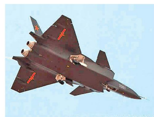
Prototyp des chinesischen J-20.

Ende 2010 sind erste Informationen und Bilder einer neuen chinesischen Kampfflugzeugentwicklung (Bezeichnung J-20) erschienen. Bereits Mitte Januar dieses Jahres hat das mit Stealth-Eigenschaften ausgestattete Flugzeug seinen Erstflug durchgeführt. Dieser fand unmittelbar vor dem Besuch des US-Verteidigungsministers Gates in China statt. Die Wahl dieses Zeitpunkts dürfte als Machtdemonstration der chinesischen Militärführung gegenüber den USA gedient haben.