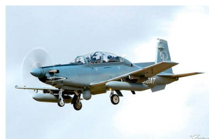
Leichtes Angriffsflugzeug Bechcraft AT-6B.

Die Gruppen der bewaffneten Taliban, die heute praktisch überall in Afghanistan operieren, sind oftmals im urbanen oder auch in unwegsamen Gebieten unterwegs; und dies