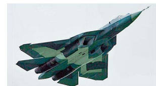
Prototyp des neuen Kampfflugzeugs der fünften Generation PAK FA.

Anlässlich des Besuchs des russischen Präsidenten Medwedew in Indien haben die beiden Staaten im Dezember 2010 auch Fragen der Rüstungszusammenarbeit besprochen. Von besonderem Interesse ist dabei ein Abkommen, das die gemeinsame Entwicklung eines neuen Kampfflugzeugs für die indische Luftwaffe beinhaltet. In einer Vorentwurfsphase soll in den nächsten 18 Monaten ein Projekt definiert werden, das etwa im Jahre 2016 zum Bau eines Prototypen führen soll. Als Vertragspartner sind auf russischer Seite die staatliche Exportagentur Rosoboronexport sowie die Sukhoi Holding genannt worden, auf indischer Seite ist der Konzern Hindustan Aeronautics Ltd (HAL) mit Sitz in Bangalore zuständig. Die indische Bezeichnung für das Projekt lautet FGFA (Fifth Generation Fighter Aircraft). Technologisch wird diese Kampfflugzeugentwicklung auf dem russi-