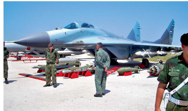
Serbien verfügt heute noch über wenige MiG-29M.

Gemäss Planung sollen die Land- und Luftstreitkräfte in den nächsten Jahren modernisiert und auf die neuen Anforderungen ausgerichtet werden. Vorgesehen ist eine rasche Reduktion der noch in grosser Zahl vorhandenen schweren Waffensysteme (Kampf- und Schützenpanzer, Artilleriegeschütze), die teilweise noch aus früherer sowjetischer Produktion stammen. Ein wesentlicher