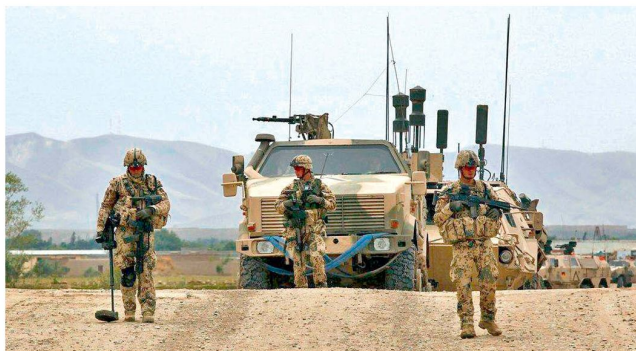
Neue Bedrohungen (z. B. Sprengfallen) erfordern die rasche Zuführung neuer Mittel.

im Einsatz Schutz und Einsatzfähigkeit rechtzeitig zur Verfügung zu stellen. Es sollen künftig die Mittel rasch beschafft werden, welche eine schnelle Einsetzbarkeit garantieren und auf jene Systeme soll vorerst verzichtet werden, die ihre Fähigkeit erst viel später erbringen. Dieser Paradigmenwechsel verbunden mit einer primären Ausrichtung auf den Einsatz bedeutet, dass künftig bei Rüstungsbeschaffungen in Deutschland auf das Bestmögliche verzichtet werden soll, um das Notwendige rechtzeitig realisieren zu können.