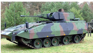
Technologie des Spz «Puma» für das US Ground Combat Vehicle?

Zuführung von geschützten MRAP-Fahrzeugen (Mine Resistant Ambush Protected) erste Priorität. Die US Army will sich gemäss eigenen Aussagen in nächster Zeit noch vermehrt auf Einsätze gegen asymmetrische und unkonventionell kämpfende Gegner im In- und Ausland vorbereiten. Vor allem der Einsatz im Inland soll weitere Veränderungen in der Ausbildung und beim Material zur Folge haben.