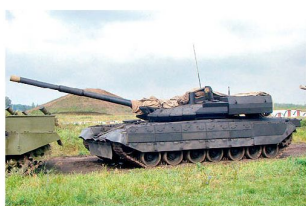
Für den Kampfpanzer «Black Eagle» (Bild) besteht kein Bedarf mehr.

Zusammen mit diesen Budgeterhöhungen sollen auch die Investitionen in die eigene Rüs-