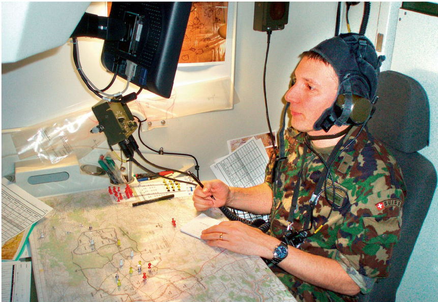
Führung ab Bataillonsführungsstafel.

Simulation. In der Ausbildung geht es vor allem um die zeit- und lagegerechte Entschlussfassung und Befehlsgebung sowie die Auftragsstaktik in der Gefechtsführung. In Abhängigkeit der Leistungsfähigkeit der Bataillone können in den Simulationen