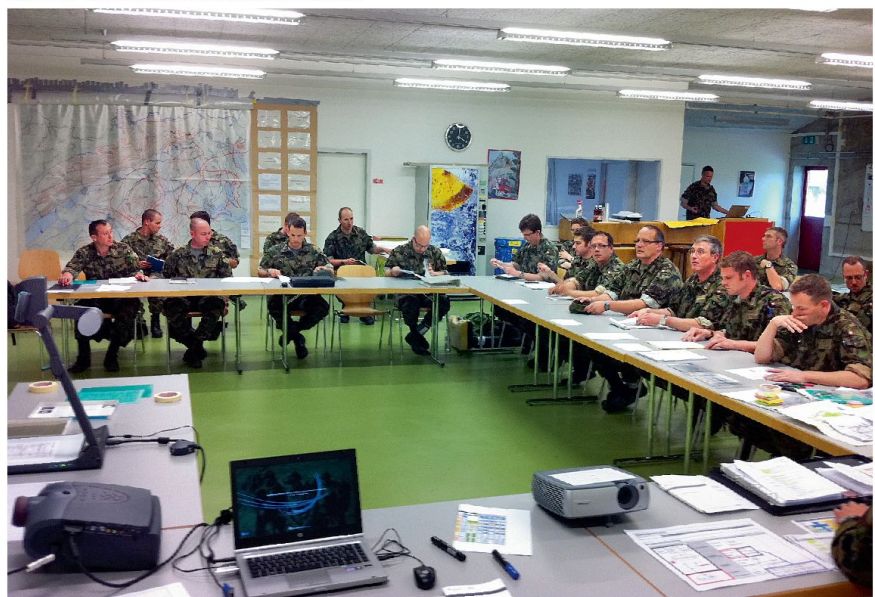
Abb. 2: Entschlussfassungsrapport mit den unterstellten Kommandanten.

vor Basel aufgelaufenen Gegner in die Flanke zu stossen. Die zweite Panzerbrigade hält sich bereit, den Bereitschaftsraum «ALPHA» zu beziehen und die Operation zu unterstützen.