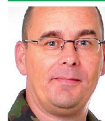
Brigadier Jacques F. Rüdin lic. iur. Kommandant Lehrverband Genie/Rettung 4528 Zuchwil

2013 sollen die Konzepte abgeschlossen und die Prozesse definiert werden (insbesondere in den Bereichen Material, Finanzen und Logistik). Budgetierung, Erstellung von Dokumenten und Beschaffung des Materials sind für 2014 geplant. Im Jahr 2015 ist vorgesehen, dass das militärische Personal im Geniedienst aller Truppen ausgebildet wird. Ab 2016 ist die Einführung bei der Truppe geplant. ■