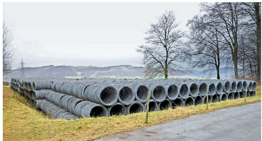
Der Geniedienst aller Truppen nach dem Konzept der Armee 61

Das Reglement 51.92 «Bau von Feldbefestigungen» aus dem Jahre 1975 definiert den Geniedienst aller Truppen wie folgt: «Das vorliegende Reglement nimmt als gegeben an, dass alle Feldbefestigungen innerhalb weniger Tage nach Kriegs-