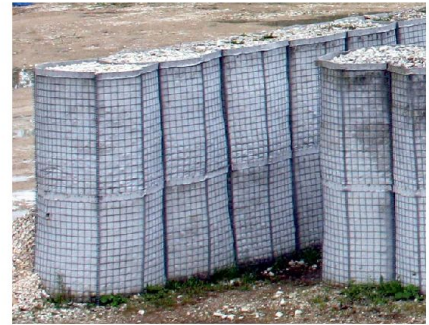
Abb. 4: Härtung einer militärischen Infrastruktur mit Schüttgutkörben.

Aufgrund der vorgesehenen Bestandesreduktion im Rahmen der Weiterentwicklung der Armee (WEA) und der daraus abzuleitenden Bedürfnisse kann davon ausgegangen werden, dass die Geniesätze redimensioniert werden können. Zusammen mit den bereits 2007 liquidierten Wellblechunterständen werden voraussichtlich rund 14 500 Tonnen Material ausser Dienst gestellt. Dies entspricht etwa 580 Lastwagenladungen oder einem Volumen von 56 000 m 3 . In einem ordentlichen Ausschreibungsverfahren wurde eine Recycling-Firma mit der Liquidation des Materials beauftragt.