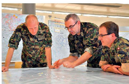
Stabsarbeit im Kombi-Lehrgang 2012: Mit Systematik und offenem Geist zu tragfähigen Handlungsoptionen.

Das Übungsszenario ist so angelegt, dass von Anfang an mit einer Eskalation der Lage zu rechnen ist. Parallel zu den Stäben auf Stufe Ter Reg plant deshalb ein Kernstab «Einsatzverband Boden» sowie ein Kernstab «Einsatzverband Luft» den Übergang in die Verteidigung. Wäh-