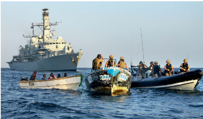
Operation ATALANTA: HMS Montrose greift Piraten auf.

Die EU steht heute nicht nur in der Wirtschafts- und Währungsunion an einem Scheideweg, sondern ebenso bei der gemeinsamen Sicherheits- und Verteidigungspolitik. In beiden Bereichen stellt sich die Kernfrage, wie weit die 27 EU-Länder in Zukunft bereit sein werden, auf bisher bedeutsame Souveränitätsrechte zu Gunsten des Kollektivs der EU zu verzichten. Bisher scheint man vor allem darin übereinzustimmen, die «Entwicklung Europas zu einer globalen Gestaltungskraft» vorantreiben zu wollen, wie es kürzlich in einem Arbeitspapier der EU ausgedrückt wurde. Dies ist aber nach der dezidierten Meinung des höchsten militärischen Repräsentanten der EU nur zu haben, wenn die EU-Länder bereit sind, den hohen Preis des nationalen Souveränitätsverlustes im Bereich Sicherheit und Verteidigung zu zahlen. Damit verbunden sind derart heikle Fragen wie