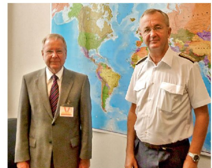
General Syrén mit dem Autor im HQ der EU.

Die EU steht heute nicht nur in der Wirtschafts- und Währungsunion an einem Scheideweg, sondern ebenso bei der gemeinsamen Sicherheits- und Verteidigungspolitik. In beiden Bereichen stellt sich die Kernfrage, wie weit die 27 EU-Länder in Zukunft bereit sein werden, auf bisher bedeutsame Souveränitätsrechte zu Gunsten des Kollektivs der EU zu verzichten. Bisher scheint man vor allem darin übereinzustimmen, die «Entwicklung Europas zu einer globalen Gestaltungskraft» vorantreiben zu wollen, wie es kürzlich in einem Arbeitspapier der EU ausgedrückt wurde. Dies ist aber nach der dezidierten Meinung des höchsten militärischen Repräsentanten der EU nur zu haben, wenn die EU-Länder bereit sind, den hohen Preis des nationalen Souveränitätsverlustes im Bereich Sicherheit und Verteidigung zu zahlen. Damit verbunden sind derart heikle Fragen wie