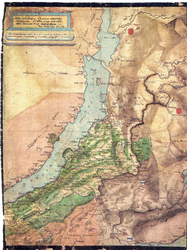
Zürcher Militärkarte «Wädenswiler Quartier» von Hans Konrad Gyger um 1650 (aus «Geschichte des Kantons Schwyz, 3»).

Der gesamte Schwyzer Auszug war mit insgesamt rund 6200 Mann somit bedeutend kleiner als Zürichs Infanterie.