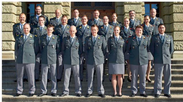
Die Absolventinnen und Absolventen.