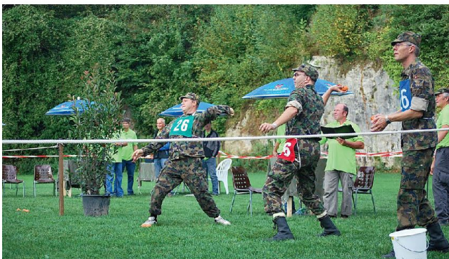
Mit vollem Einsatz dabei.