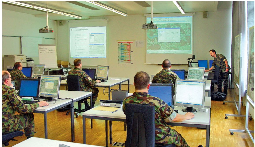
Technik beherrscht heutige Kommandoposten, aber der Geist des Menschen ist immer noch der entscheidende Faktor.

Im Armeestab seien «Techniker» in grösserer Zahl vertreten gewesen als die «Taktiker». Ein Stab einer modernen Armee brauche offenbar mehr Techniker und Spezialisten, und deren Leistung sei keinesfalls