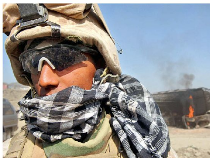
Stillstand in Afghanistan: die Strategie ist festgefahren und die Energie verpufft ohne Wirkung.

Dass aus Sicht der Vereinigten Staaten noch einiges zum Innenleben der Entscheidungsfindung im Vorfeld der Einmischung