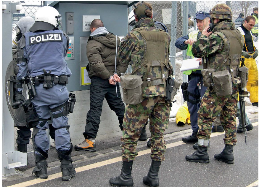
Gemeinsames Interventionstraining von Militär und Polizei zur Überprüfung des Einsatzdispositives.

«Der Schutz eines Anlasses vom Ausmass des WEF in Davos kann in der Schweiz nur noch im Sicherheitsverbund Polizei/Armee sichergestellt werden. Dank den herausragenden Fähigkeiten unserer Milizarmee aber auch der hohen Motivation der Truppe und der Verantwortlichen im Führungsstab der Armee kann ich als Gesamteinsatzleiter für die Sicherheit am WEF eine durchwegs positive Bilanz ziehen.»