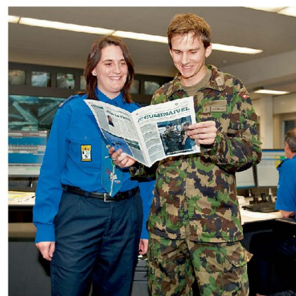
«Cuminaivel» – das Informationsmagazin für die eingesetzten Sicherheitskräfte.

die Lage heute wesentlich komplexer. Die Zusammenarbeit ist mittlerweile eingespielt und geprägt von gegenseitigem Respekt. Gemeinsam suchen die Partner immer wieder die bestmöglichen Lösungen im Sinne der Sache. Diese Kooperation ist das gelebte Beispiel für den Sicherheitsverbund Schweiz.