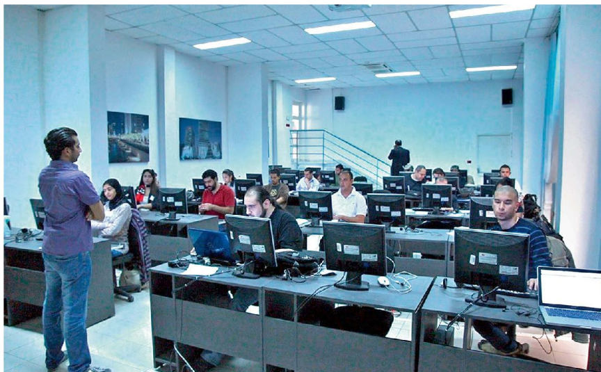
Für die tunesischen Wahlen hat das DCAF im Auftrag der Wahlbehörde ein modernes «Election Security Monitoring Center» geschaffen.

Bekämpfung des organisierten Verbrechens und des Menschenhandels. Das DCAF ist