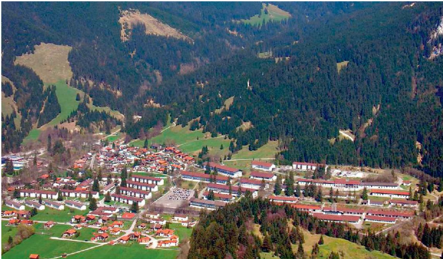
Die NATO-Schule befindet sich im Kasernenkomplex am rechten oberen Dorfland, in den neuen Gebäuden ganz oben.

anlässe im Januar, das «NATO Defence Planning Symposium» und das «NATO Partnership Symposium», die etwa 450 Teilnehmer vereinigen.