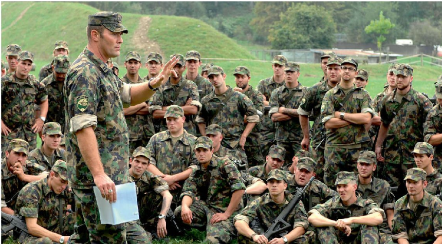
Übungsbesprechung nach einer Kompanieübung.

Repetition zu korrigieren. Dies wiederum bedingt, dass sich die Übungsleitung vor allem auf die laufende Kontrolle und Evaluation der übenden Truppe sowie auf die daraus resultierenden Korrekturmaßnahmen konzentrieren kann und sich nicht primär mit einem überambitionierten und komplizierten Übungsablauf herumzuschlagen hat. Man muss auch nicht