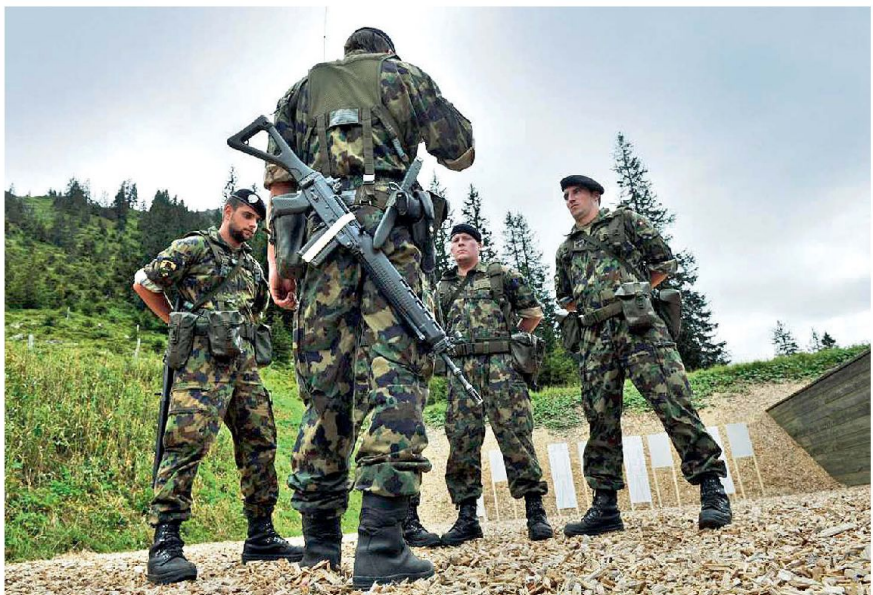
Arbeit in der Gruppe.

Das Können hängt aber nicht nur von den zur Verfügung gestellten Ressourcen, sondern auch vom Wissen («savoir») bzw. den Fertigkeiten der eingesetzten Wehrmänner ab. Letzteres sicherzustellen, ist die zentrale Aufgabe der militärischen Ausbildung.