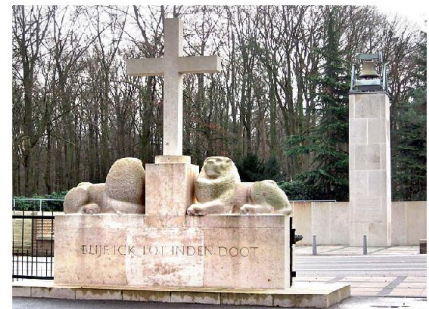
Das Denkmal auf dem Grebbeberg erinnert an den raschen Verlust der Freiheit 1940 und den langen Weg bis zur Rückeroberung.