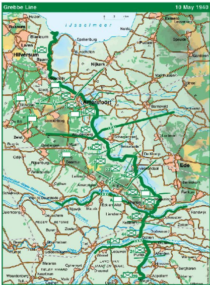
Die Grebbelinie zwischen der Maas und dem IJsselmeer.