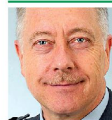
KKdt André Blattmann Chef der Armee 3003 Bern