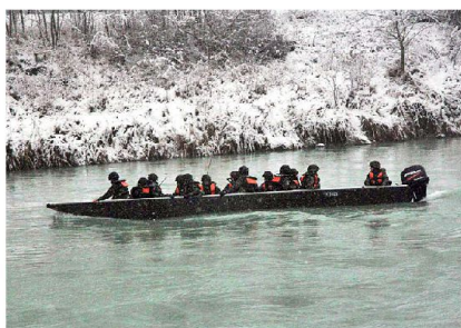
Übersetzaktion der Bausap Kp 23/4 auf der Rhône im Raum Villeneuve.

Der Kdt LVb G/Rttg will damit den Grossen Verbänden die maximale Unterstützung in den Bereichen Weiterausbildung der Kader, Verbandsausbildung, Ein-