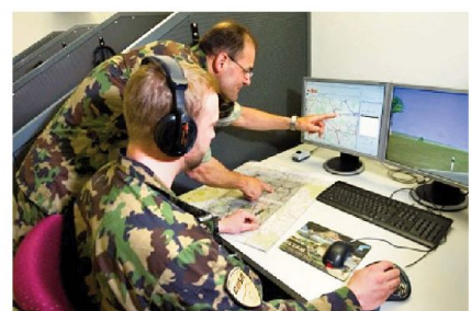
Teilsicht Arbeitsplatz «Mitübende» ELTAM.

Als Kompetenzzentrum für simulationsgestützte Ausbildung verfügt das MAZ über folgende Gross-Simulatoren: Taktiksimulator für mechanisierte Verbände (ELTAM), Schiessausbildungsanlagen für den Panzer 87 Leopard WE (ELSA Leo WE), den Schützenpanzer 2000 (ELSA S), die Schiesskommandanten und Vermesser/Beobachter (ELSA SKdt/ZVBA) sowie die Fahrsimulatoren Panzer (FASPA) für den Pz 87 Leo WE und den Spz 2000.