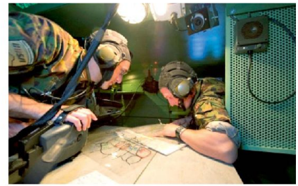
Teilsicht Kampfraum ELTAM: Kp Kdt mit seinem Fhr Geh in einem Kdo Spz 2000.

Im Zweijahresrhythmus werden alle Offiziere eines Bataillons in der Führung des Gefechtes der verbundenen Waffen geschult. Der Bat Kdt, der Bat Stab und die Kp Kdt führen von ihren Kommandofahrzeugen aus. Die Zugführer befehlen ihren Zug mit allen Gefechtsfahrzeugen sowie abgesehenen Gruppen über eine Eingabehilfe an den Einzelarbeitsplätzen. Eigene wie auch gegnerische Truppen können bedarfsgerecht zusammengestellt werden. In der Regel führt ein Chef «ROT» gemäss Weisungen des Übungslei-