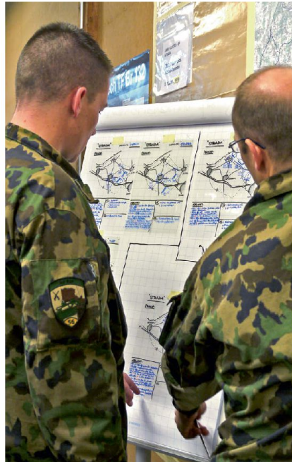
Das Denken in Varianten beherrscht auch die Taktik.

während des Kurses in die Modulbausteine sämtlicher Verbände Einsicht zu nehmen. Insbesondere ist auch der Wissensaustausch zwischen den Teilnehmern sehr wertvoll.